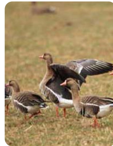
——— マガン ———

ヒシクイ・マガン共にカモ科、くちばしが黒っぽく、先端付近のみが黄色いのがヒシクイ、くちばしが橙色でその周りが白いのがマガン。ヒシクイの方が体が少し大きい。春(主に3～4月)と秋(主に10月～11月)に十勝川下流から太平洋岸の湿地湖沼群やその周辺の農地に数千羽が飛来する。農耕地では牧草や秋蒔き小麦の新芽を食べるため、作物への影響が懸念されている。