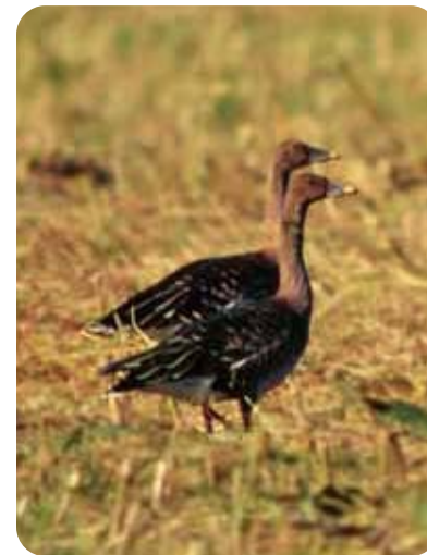
——— ヒシクイ ———

北海道に約1300羽生息し、ロシアと中国にも1300～1400羽生息している。十勝地方でも約50つがい繁殖し、冬期にはほとんどが釧路の給餌場に移動するが、近年十勝でも一部が越冬している。