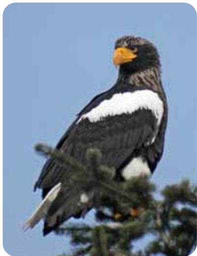
——— オオワシ ———

『オオワシ、オジロワシ、タンチョウ、ヒシクイ、マガン』5種の天然記念物を見ることができるのは世界でも道東の限られた場所で見ることができます。