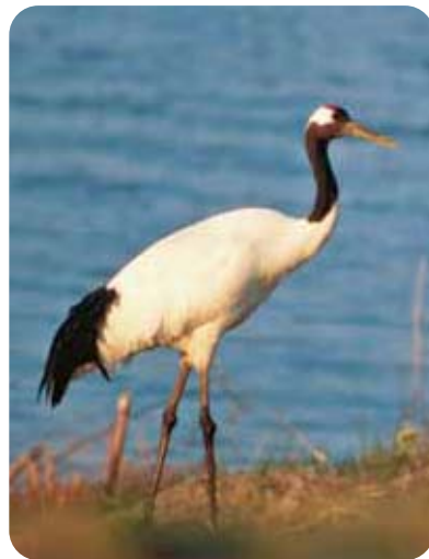
——— タンチョウ ———

ユーラシア大陸で5000～7000つがい繁殖し、日本(北海道)でも50～100つがい繁殖し、十勝地方でも数つがい繁殖している。主に冬期にロシア方面から約1000羽飛来する。