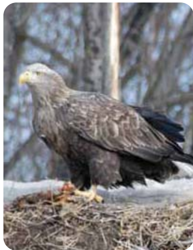
——— オジロワシ ———

世界でロシア極東地方周辺で繁殖し、約2200つがい繁殖していると推定される。日本には冬期間に約1500羽飛来し、十勝では11月中旬から4月中旬まで海岸線や十勝川水系沿いに見られる。