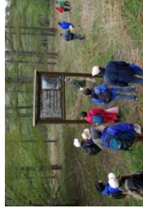
旧浦幌炭鉱市街地と標識

かつてこんなに賑やかな街があったなんて驚き！旧浦幌炭鉱市街地(約2キロ)には、ポイント毎に当時(70～80年前)の写真や載せた標識が設置され、当時の思い出ができます。戦後の復興を支えた産業遺産は、私たちに何を問いかける？