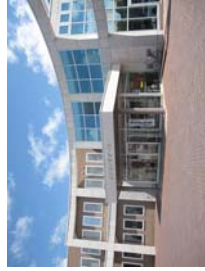
浦幌商工会(コスミックホール)

浦幌町は人口5,257人(平成26年現在)の十勝管内で最も東に位置する町です。町名はアイヌ語で「川尻に大きな葉が生育するところ」を意味する「オー・ラ・ポロ」が語源。観光名所は道内屈指のアルカリ性温泉である秘湯「留真温泉」、多くの観光客でにぎわう「道の駅うらほろ」、海と切り立った崖の景色が美しい「昆布刈石展望台」など。懇親会は浦幌商工会に隣接する「コスミックホール」で行います。