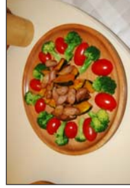
カボチャと無添加ウインナーの炒め物