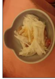
マツカワと山芋の和え物