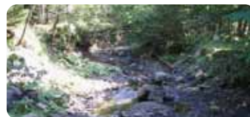
K/T 境界層 状況

恐竜絶滅の原因といわれる約6,500万年前に起きた巨大隕石の衝突は地球の歴史上の大事件!今のメキシコ・ユカタン半島に激突したらしく、その際にできた地層が、アジアで唯一、ここで発見された。世界でも30箇所しか発見されていない貴重な場所で、悠久のロマンを感じてみよう。