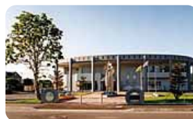
浦幌町立博物館 外観

浦幌町立博物館では、浦幌の自然、歴史、生活、文化を大きな6つのコーナーに分けて展示しています。CG、写真パネル、ジオラマ、ビデオ、音響などわかりやすく楽しめる工夫がいっぱい。ガイドの話を聞きながら回れば、あなたも浦幌博士になれる!?