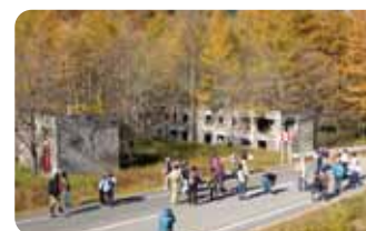
炭山～留真温泉ルート

かつてこんなに賑やかな町があったなんて驚き!このルートにはポイント毎に往時の写真を載せた案内板が設置され、当時を忍ぶことができます。戦後の復興を支えた近代化遺産は私たちに何を問いかける?