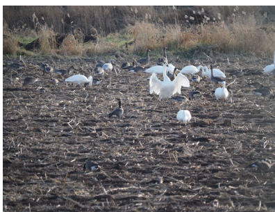
ガン類、オオハクチョウ