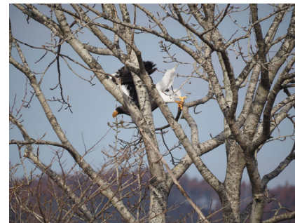
猿別川下流、オオワシ