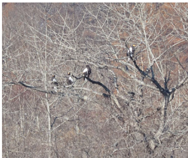
十勝川新水路、オオワシ4羽